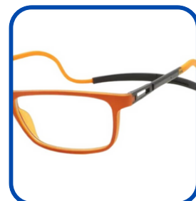
Filtro Luz azul