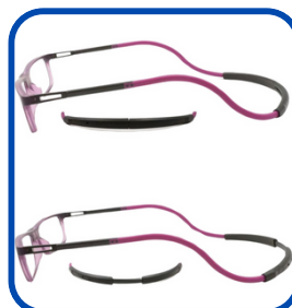
Banda flexible intercambiable